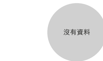
校長及教學人員幼兒教學年資 (2018年3月資料)