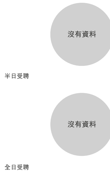
校長及教學人員幼兒教學年資 (2018年3月資料)